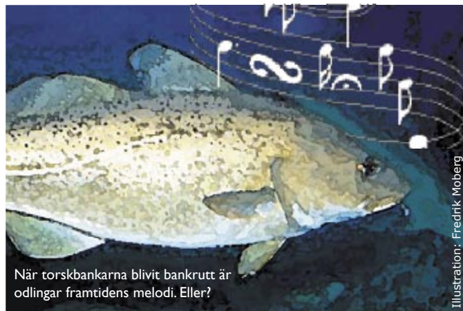
När torskbankarna blivit bankrutt är odlingar framtidens melodi. Eller?

Fiskodlingar har även stor inverkan på närområdet: fodret som inte äts upp och avföringen ifrån den odlade fisken kan skapa övergödning och bottendöd, eftersom allt syre går åt till att bryta ned det organiska materialet. Dessutom har det förekommit att odlad fisk rymmer. Deras gener är avlade efter karaktärsdrag som främjar fiskodlare men inte vild fisk. Om de förökar sig med fisk från de vilda bestånden sprids de framodlade generna. Hybriderna har ofta lägre överlevnad och förökningsförmåga.